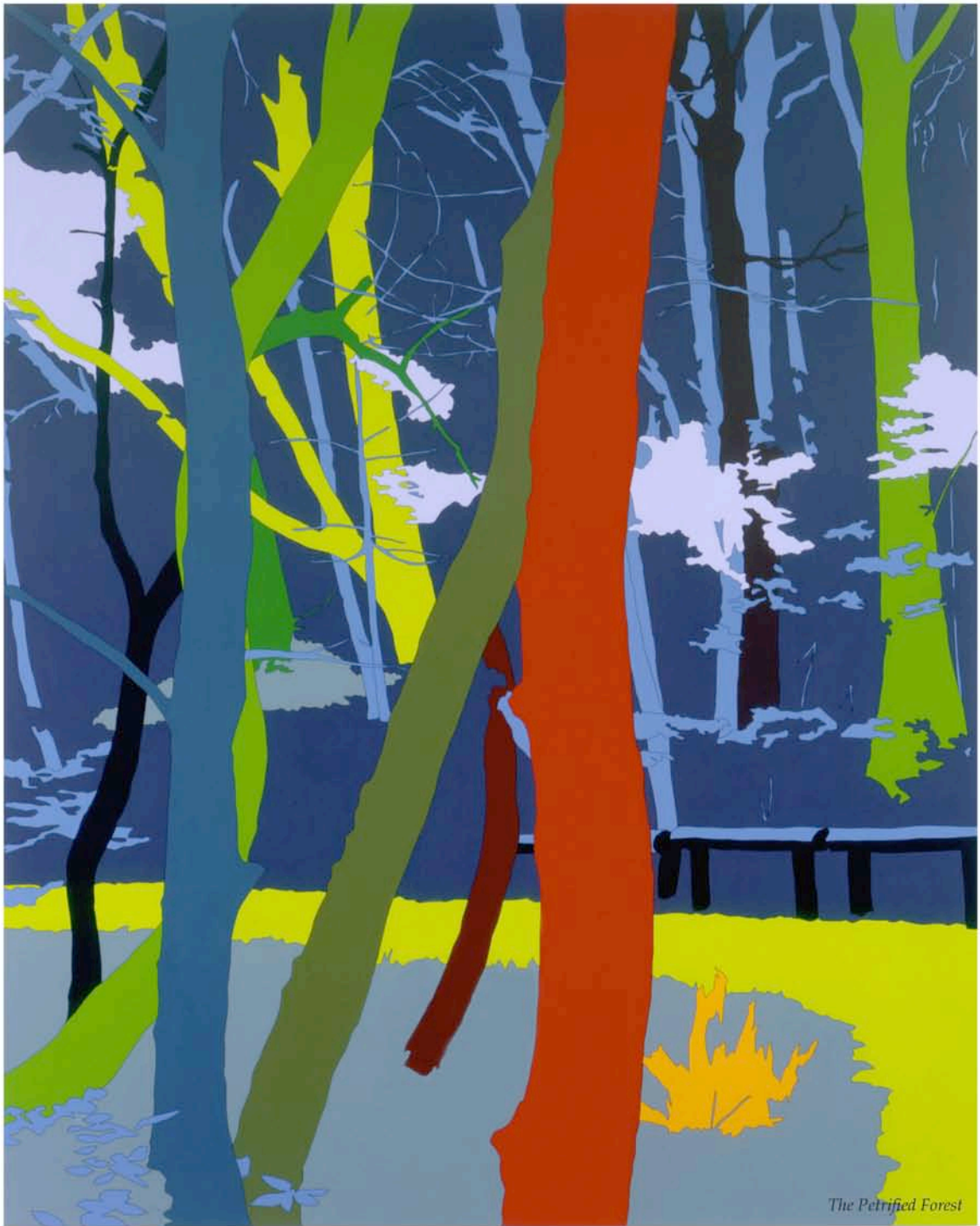
The Petrified Forest